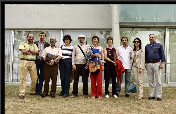
Reunión de la AME. Madrid 26-06-2006